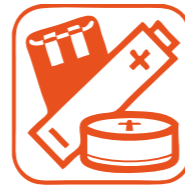
PILES ET ACCUMULATEURS