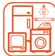
DÉCHETS D'ÉQUIPE- MENTS ÉLECTRIQUES ET ÉLECTRONIQUES