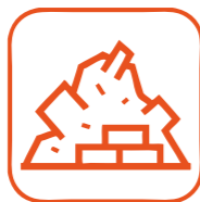
DÉBLAIS / GRAVATS